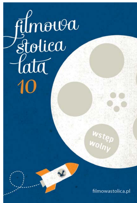
Fot. Adrian Krawczyk