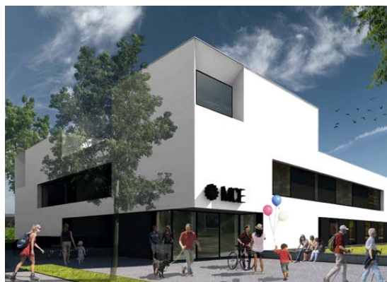
▲ Budynek Międzypokoleniowego Centrum Edukacji – wizualizacja Piotr Bujnowski – architekt

użytkowej blisko 3 000 m 2 i kubaturze prawie 13 000 m 3 znajdą się: filia Biblioteki Publicznej, filia Centrum Kultury Wilanów, pomieszczenia dla najmłodszych i seniorów.